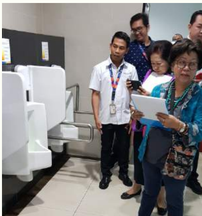
Kegiatan Penilaian Toilet Bersih Bandara

Dalam situasi pandemi COVID-19 seperti sekarang ini, kesehatan menjadi faktor utama dalam kegiatan masyarakat. Dengan ketersediaan fasilitas toilet umum yang bersih dan higienis, penyebaran virus dapat dikurangi, apalagi bagi kaum urban yang memiliki mobilitas tinggi.