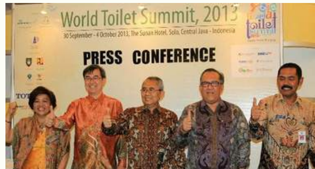
World Toilet Summit, 2013

World Toilet Summit memberikan dampak yang baik dan mendapat apresiasi dari WTO, serta menjadi kegiatan pecontohan bagi negara-negara yang tergabung dalam WTO.