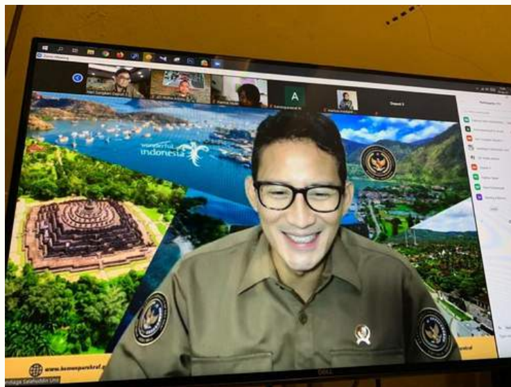
Menparekraf Sandiaga Uno

Sandiaga melanjutkan, bahwa toilet di tempat wisata pun harus memiliki desain dan fasilitas yang baik. Sebab, sarana tersebut dinilai dapat mempengaruhi tingkat kunjungan wisata.